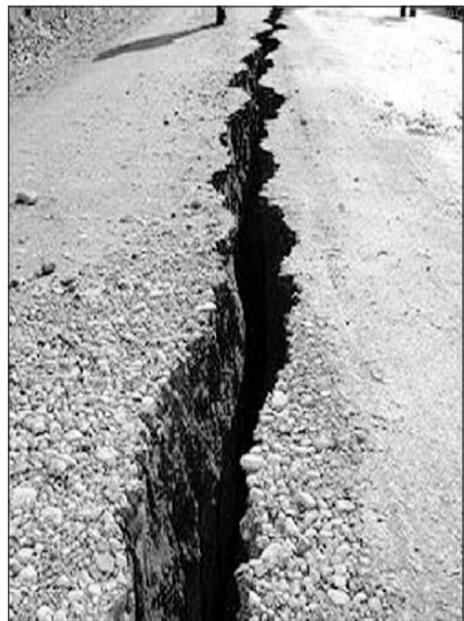
Un'immagine degli effetti del terremoto a L'Aquila