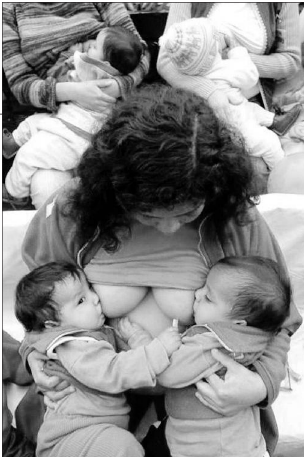
L'allattamento al seno è molto importante: protegge il fegato del bambino da patologie precoci