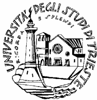
Università degli Studi di Trieste