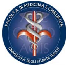
Facoltà di Medicina e Chirurgia