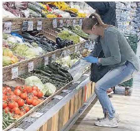
Spesa al reparto ortofrutta in un supermercato

Mentre rimangono invariati i servizi sanitari e le spese per la salute e istruzione, registrano invece un lieve aumento i Trasporti (+0,6%) e Ricreazione, spettacoli e cultura (+0,6%). Rispetto a giugno dell'anno scorso, emerge che l'aumento maggiore si registra alla voce Prodotti alimentari e bevande analcoliche (+4,4%), alla quale seguono Bevande alcoliche e tabacchi (+2%) e Servizi sanitari e spese per la salute (+0,8%). Calano invece Tra-